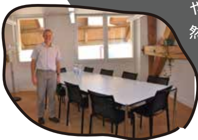
スイスの小さな村の 議場は会議室兼用