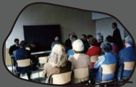
現場検証のあと、近くの 小学校教室で口頭弁論が 開かれるドイツの裁判

閉鎖的なイメージの日本の裁判所を知っていると、びっくりするほどオープンなドイツ や台湾の裁判所。議会改革が進んでいるはずの日本の地方議会と比べて、さらに自 然体で合理的な運営が行われているスイスやドイツの議会。